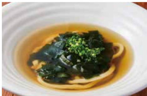
大わかめうどん（温）

うどんは厳選した国産小麦をブレンドし独自のもちもち食感がある麺と、熊本天草産の鰹からなる5種の削り節からとった出汁が自慢です。カツは低温調理で柔らかくお肉の旨みが凝縮されています。