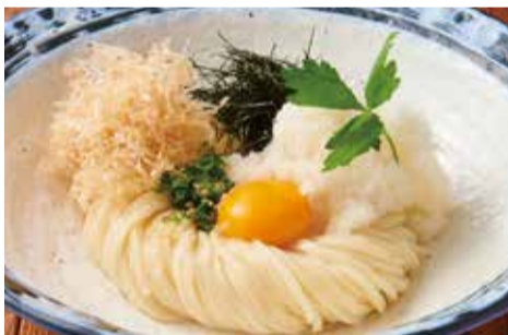
鬼おろしぶっかけ（冷）