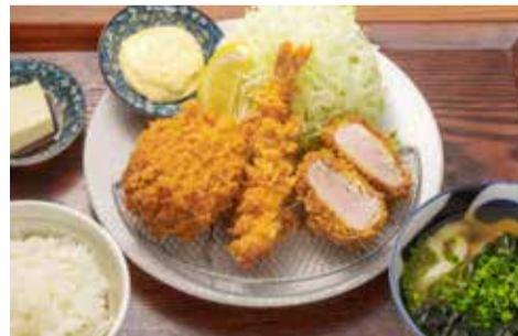
ミックスフライ定食