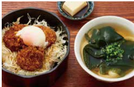
名物タレカツ定食 小うどん付き