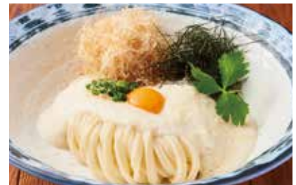
▲ 山芋とろろぶっかけ