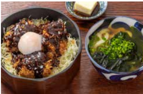
味噌ヒレカツ定食 小うどん付き