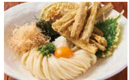
▲ ごぼう天ぶっかけ